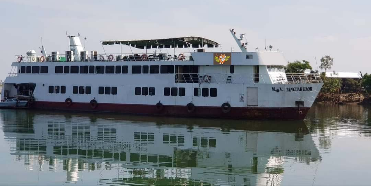
ছবি: এম, ভি টাংওয়ার হাওড়। স্থান: টাংওয়ার হাওড়।

টাঙ্গুয়ার হাওর মাছ উৎপাদনে গুরুত্বপূর্ণ ভূমিকা পালন করে কারণ এটি দেশের জন্য 'মৎস্য সম্পদ হিসেবে কাজ করে। প্রতি শীতকালে হাওরে প্রায় ২০০ ধরনের পরিযায়ী পাখি থাকে। হাওর মাছের একটি গুরুত্বপূর্ণ উৎস। হাওরে মিঠা পানির মাছের ১৪০ টিরও বেশি প্রজাতি রয়েছে। এদের মধ্যে আরো প্রধান্য পায়: আয়ীর, গাং মাগুর, বৌম, তারা, গুটুম, গুলশা, টেংরা, তিতনা, গড়িয়া, বেটি, কাকিয়া ইত্যাদি হিজল, কারাচ, গুলি, বালুয়া, বান তুলসী, নলখাগড়া এবং অন্যান্য মিঠা পানির জলাভূমি গাছ এই হাওরউদ্ভিদ প্রজাতি যেমন হিজোল (ব্যারিংটনিয়া আকুতাপুলা), ক্লেমাটিস ক্যাডমিয়া, ক্রাটেভা নুরওয়াল, ইউরিয়াল ফেরক্স, নেলুশো নিউসিফেরা, অটেলিয়া অ্যালিসময়েডস, অক্সিস্টেলমা সেকামোন ভার।